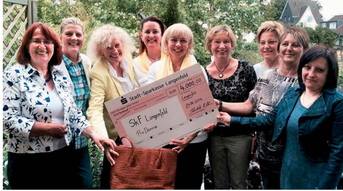
Scheckübergabe an ProDonna.