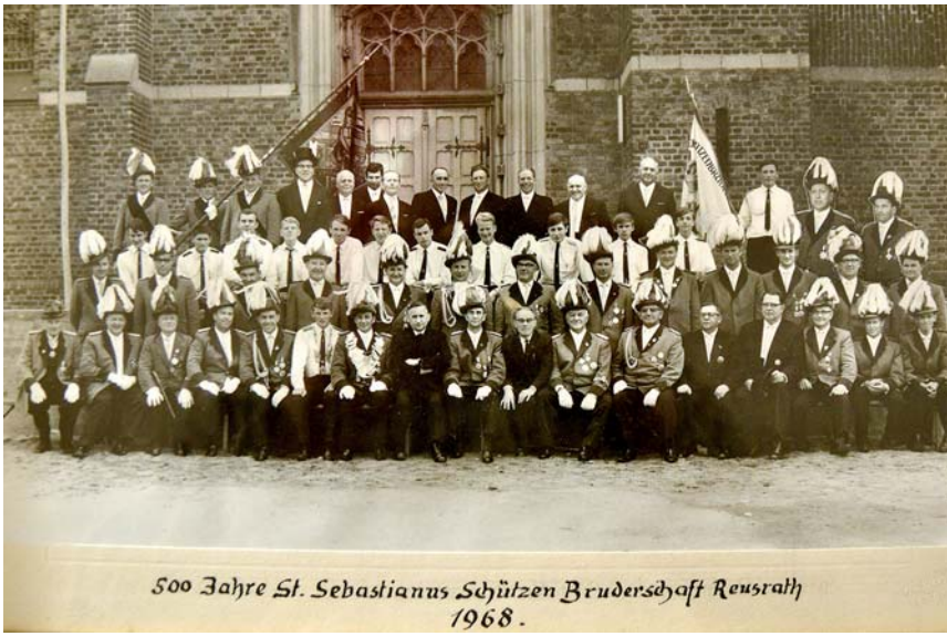
Ein historisches Dokument: Die St. Sebastianus Schützenbruderschaft Reusrath 1968 im Jahr ihres 500-jährigen Jubiläums.