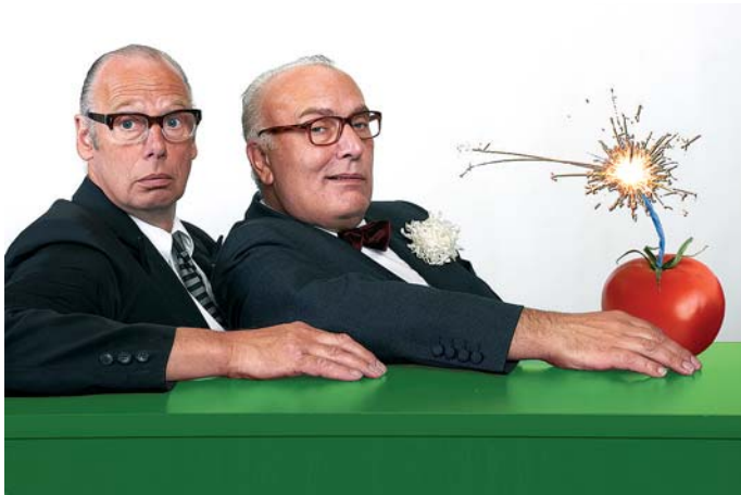
Pause + Alich: „Früchte des Zorns“.

Eintrittskarten und Programminformationen erhalten Sie in der Vorverkaufsstelle im Schauplatz-Foyer sowie unter: www.schauplatz.de