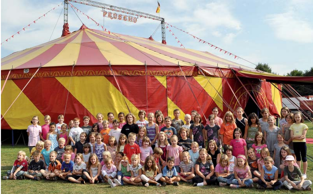
Im Freizeitpark wird mit dem Circus Proscho zusammengearbeitet.