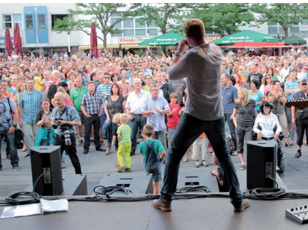
Auf dem Marktplatz wird bei „Langenfeld live“ die Stimmung wieder überkochen.

Über die Karibische Nacht, Langenfeld live und die Kirche der LVR-Klinik