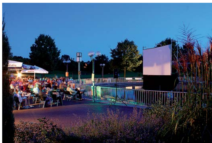
Seelichtspiele im Freizeitpark.