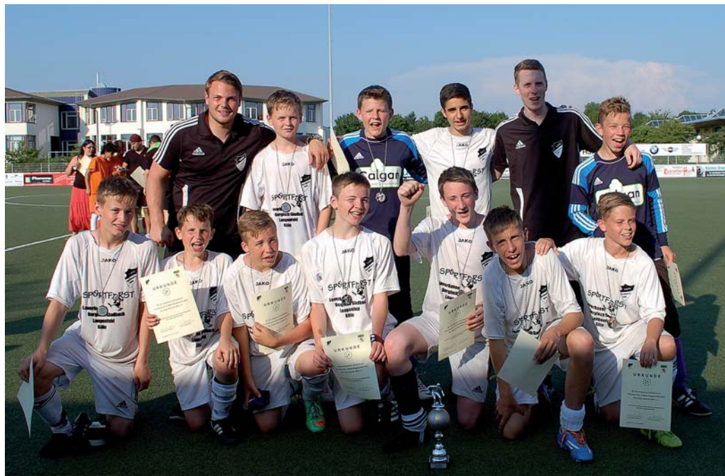
So sehen Sieger aus: Bei den D-Junioren holte Gastgeber TuSpo Richrath den Pokal. Im Finale gewann TuSpo gegen die polnischen Gäste des MKS Mazur Gostynin mit 3:1 Toren.