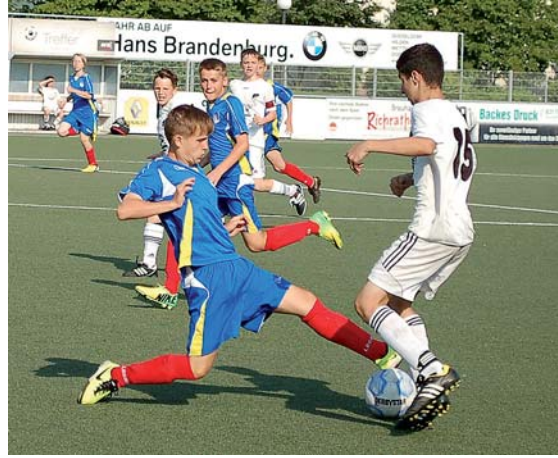
Impressionen aus dem spannenden Finale der D-Junioren: Der 3:1-Endspielsieg des TuSpo Richrath gegen Gostynin war hart umkämpft. Auf dem rechten Bild die Szene des Richrather Angriffs, der die 1:0-Führung brachte.