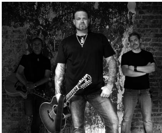
Triple Sec treten am 13.8. auf dem Marktplatz auf.