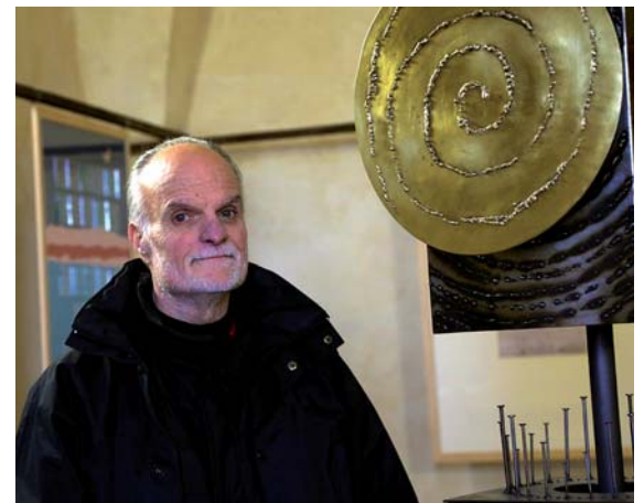
Andrea Dami mit seinen Objekten.