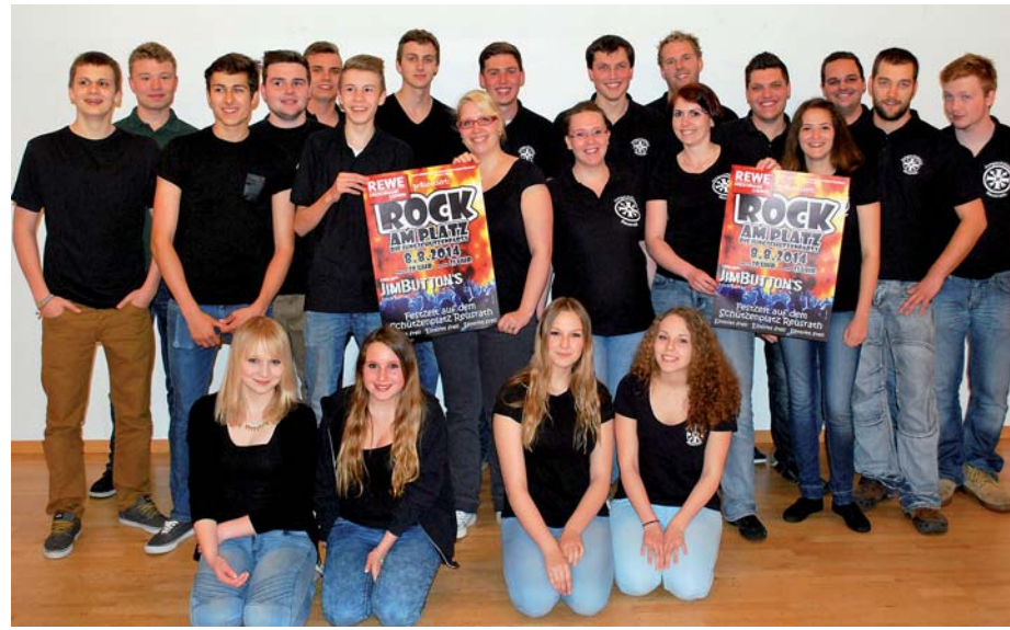
Rock am Platz beim Reusrather Schützenfest: Die Jungschützen organisieren stets den Disco-Freitag beim Schützenfest. In diesem Jahr mit einem Live-Act der Jim Button's.