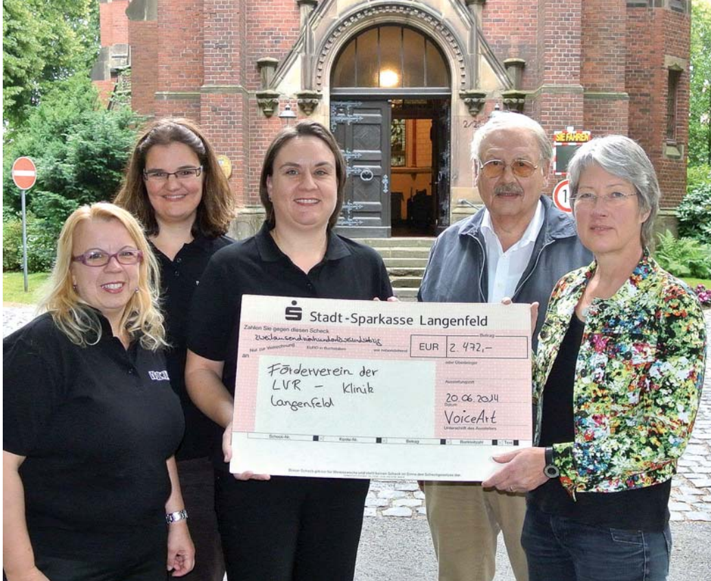
VoiceArt setzen sich für die Kirche der LVR-Klinik ein.