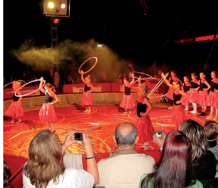
Die Kids werden bei den Galavorstellungen Mitte August zeigen, was sie gelernt haben.