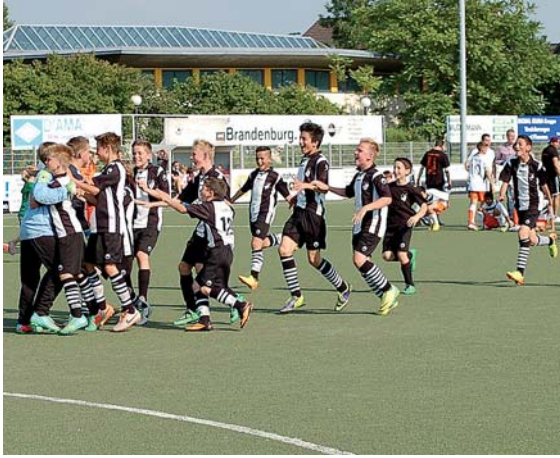
Jubel nach Krimi im Elfmeterschießen: Die Richrather D II setzte sich gegen die SF Baumberg durch und wurde Fünfter.