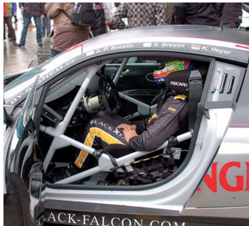
Impressionen von der VLN-Langstreckenmeisterschaft: Die Austragung des 250-Meilen-Rennens am Nürburgring hat der AC Monheim bereits 36 Mal organisiert.