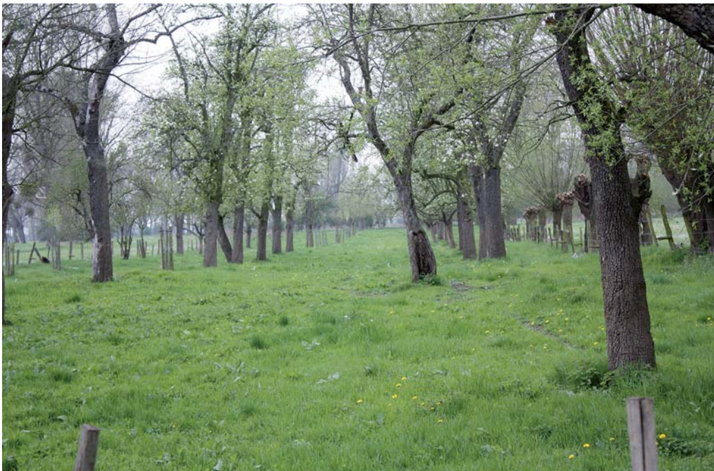
Wer auf dem Neanderlandsteig wandert, wird auch in die Urdenbacher Kämme gelockt.