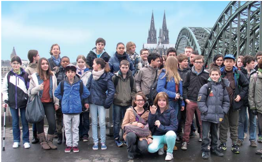
29 französische Schüler am Rhein: Mit dem großen Strom und dem imposanten Dom bietet Köln aufregende neue Erlebnisse.

An dieser Stelle werden lokale Ereignisse dokumentiert, die in der Stadt in den letzten Wochen für Gesprächsstoff sorgten und/oder in Zukunft noch sorgen werden