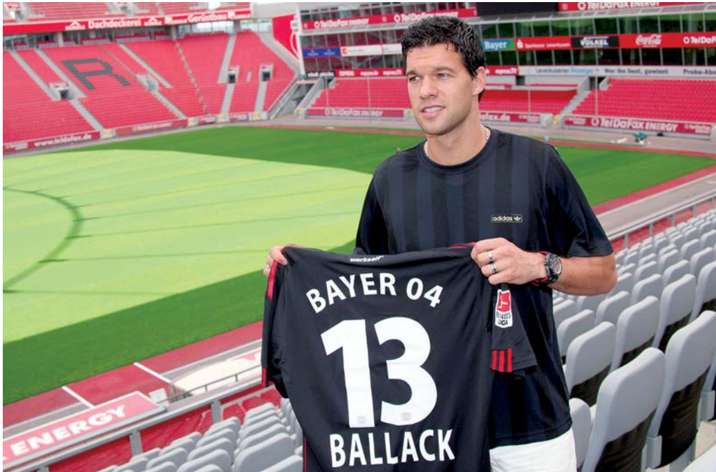
Bei einem Jugendturnier am 17.5.2012 Jahr hatte „Wir helfen Kindern“ erstmals Lose verkauft. Damals betrug der Erlös 1250 Euro. Diesmal (am 9.5.) werden zusätzlich von Michael Ballack (auf dem Foto zu sehen), Stefan Kießling und Fortuna Düsseldorf signierte Trikots meistbietend versteigert.