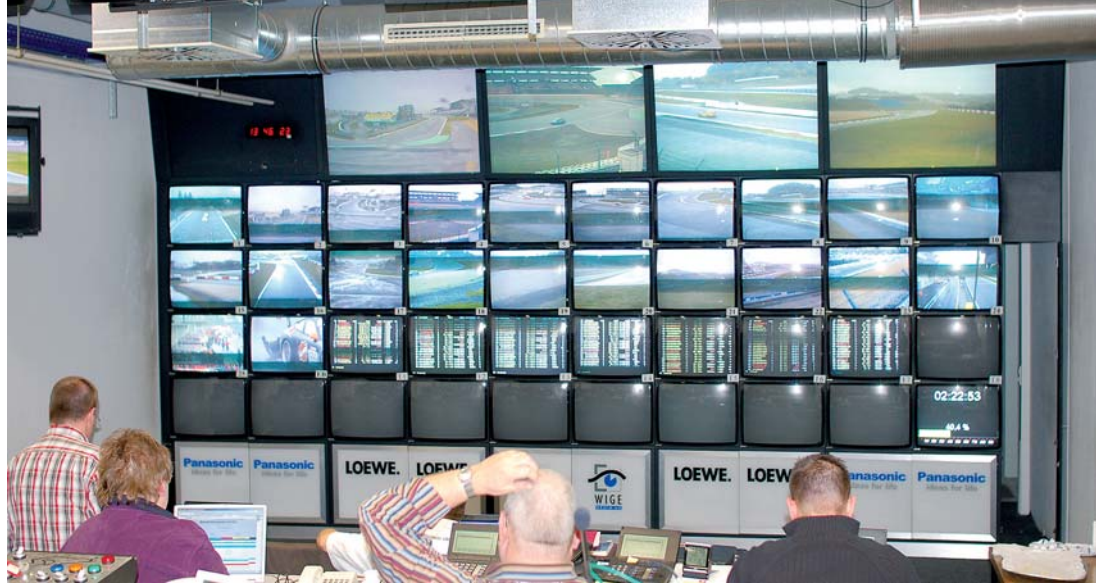
Blick ins Race-Control: Im Kontrollzentrum des Nürburgrings laufen bei den Rennen und Trainingsläufen alle Fäden zusammen.