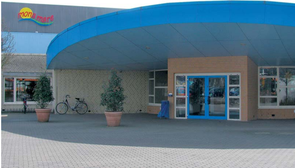
Stand im Mittelpunkt eines Themenabends der AG „30plus!“ der Jugendpartei PETO: das mona mare.