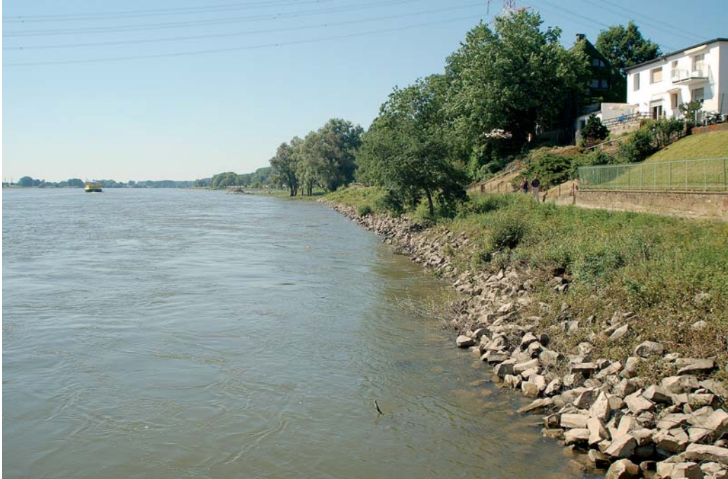
Das Rheinufer in Baumberg lädt zu einer gemütlichen Rast ein.