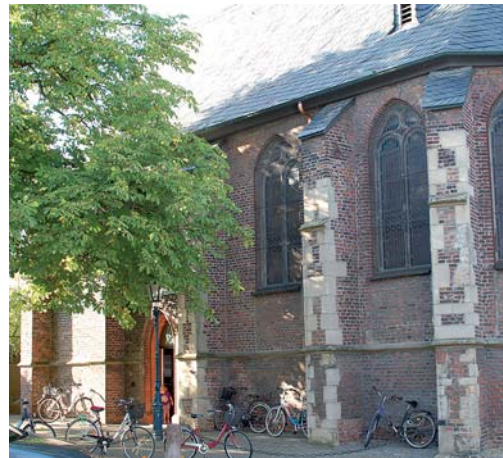
Unterhalb der Marienkapelle (Foto), an d'r Kapell, liegt die Monheimer Anlegestelle.