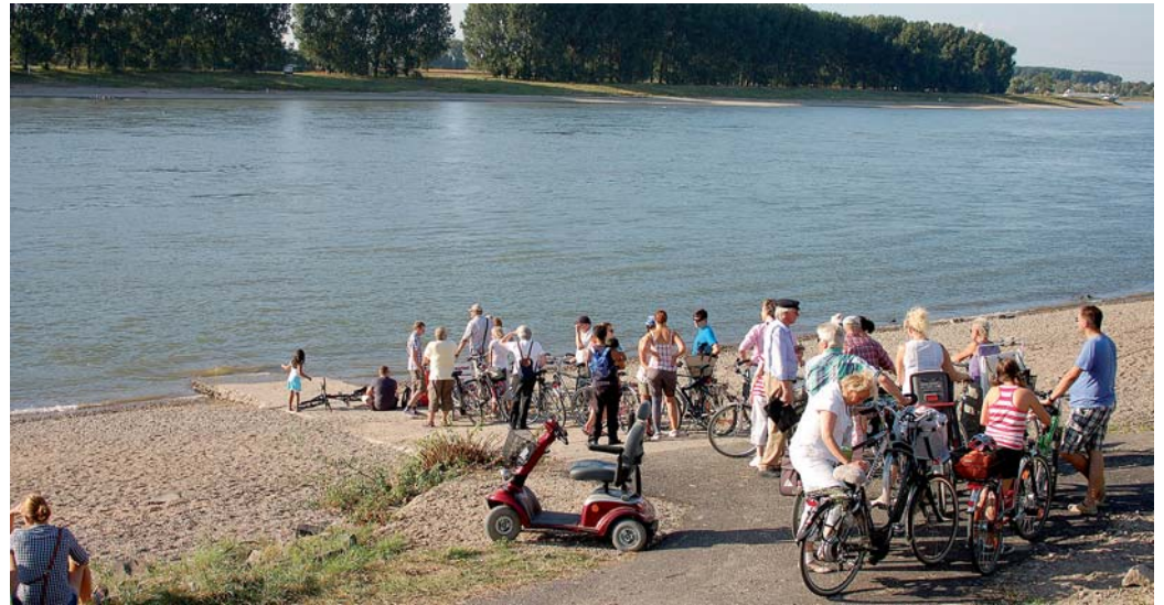
Lange Schlangen bildeten sich im letzten Jahr, um im Jahr der Wiederinbetriebnahme der historischen Fährverbindung auch mal mit dem Piwipper Böttchen fahren zu können. Um diese Warteschlangen zu verkürzen, wurde jetzt die Kapazität des Fahrzeugs erweitert.