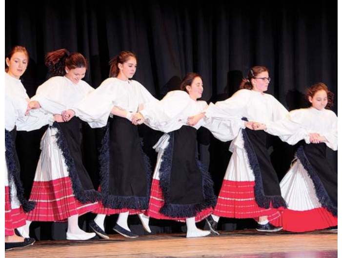
Eine Folkloregruppe bei der Veranstaltung „Kroatien mit allen Sinnen genießen“. Lesen Sie zum Thema auch Seite 2.