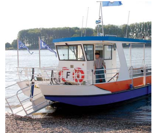
Bis in die 70er Jahre gab es die Fährverbindung über den Rhein zwischen Monheim und Dormagen; im letzten Jahr ließ man sie wieder aufleben.